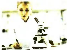
Οι συστάσεις επιχειρήσεων υψηλής τεχνολογίας στη μεταποίηση κατά την περίοδο 2011-2016 υπερτερούν των διαγραφών με 757 έναντι 599.

χνολογίας έντασης γνώσης του κλάδου των Υπηρεσιών, ο μεγαλύτερος αριθμός συστάσεων και διαγραφών, διαχρονικά, αποδίδεται στις δραστηριότητες προγραμματισμού ηλεκτρονικών υπολογιστών, παροχής συμβουλών και συναφείς δραστηριότητες (ΚΑΔ 62), ενώ ακολουθούν οι δραστηριότητες υπηρεσιών πληροφορίας (ΚΑΔ 63). Στην τρίτη θέση των συστάσεων αντάσσονται αντίστοιχα το έτος οι κλάδοι της παραγωγής κινηματογραφικών ταινιών, (ΚΑΔ 59), οι τηλεπικοινωνίες (ΚΑΔ 61) και η επιστημονική έρευνα και ανάπτυξη (ΚΑΔ 72). Συγκρινόμενη με τα υπόλοιπα κράτη-μέλη της Ε.Ε. 28 ως προς τις επιχειρήσεις υψηλής τεχνολογίας έντασης γνώσης του κλάδου των Υπηρεσιών για το 2015, η Ελλάδα κατατάσσεται στη 14η θέση σε ό,τι αφορά τις συστάσεις επιχειρήσεων υψηλής τεχνολογίας έντασης γνώσης και στην 9η σε ό,τι αφορά τις διαγραφές. Τα στοιχεία για αυτή τη διακρατική σύγκριση προέρχονται από τις έρευνες στατιστικών διάρθρωσης επιχειρήσεων που διενεργεί η Ελληνική Στατιστική Αρχή και τα οποία παρουσιάστηκαν για πρώτη φορά το 2015. [ISD:11897506]